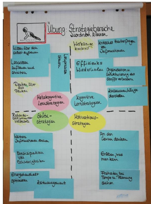
Übung „Strategien ordnen“.

Anfang Februar 2023 fand unser Workshop Metakognitive Strategien in der Berufsausbildung für die Fachlehrkräfte unseres Kooperationspartners, der Berufsbildenden Schule St. Helena mit den Ausbildungsgängen Sozialassistent und Erzieher*in, statt. Mit neun Fachlehrkräften, die unterschiedliche Fächer vertraten, war die Resonanz auf das dreieinhalb stündige Angebot hoch. Nach einer Einführung ins strategische Lernen folgten Hintergrundinformationen und Übungen zu den Strategien des sinnerfassenden Lesens und des angewandten Schreibens, stets geleitet von der Frage und der Diskussion, wie diese im jeweiligen Fachunterricht umgesetzt werden können bzw. – falls sie bereits umgesetzt werden – wie ihr Einsatz gezielter erfolgen kann, um die Lese- und Schreibvermittlung im Unterricht besser zu integrieren und somit besonders schwächere Schülerinnen und Schüler zu unterstützen. Auch wenn im Lauf der Veranstaltung deutlich wurde, dass es wahrscheinlich kein Zaubermittel zur Umsetzung dieser Ziele geben wird, so nahmen die Fachlehrkräfte doch viele Impulse und Ideen mit. Der spontane Ausspruch einer Teilnehmerin beim Aufbruch, eine solche Veranstaltung wünsche sie sich halbjährlich, kann als Bestätigung unseres Ansatzes verstanden werden.