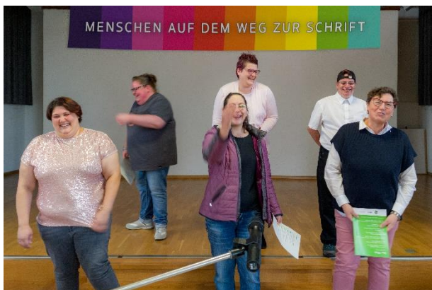
Mit Spaß und Elan beim Lesen ihrer Texte. Mitglieder der Gruppe Wortsalat bei der Vernissage ihrer Ausstellung in Hermeskeil.

Hervorzuheben ist die gute Kommunikation mit den SWR-Verantwortlichen, die sich intensiv mit dem Thema Alphabetisierung und Grundbildung beschäftigten und auf die Sorgen und Ängste der Gruppenmitglieder vor, während und nach dem Dreh gut eingingen. Anfang Juli war die Gruppe dann zusammen mit unserem Projekt Knotenpunkte Transfer und dem ALFA Mobil drei Tage lang mit Infoständen bei StadtLesen, dem Lesefestival am Domfreihof in Trier, vertreten. Schließlich präsentierte sie am 5. Oktober im Rahmen der Projekt-Kooperation mit dem Familiennetzwerk HAFEN in Hermeskeil (Hunsrück) ihre Ausstellung „Menschen auf dem Weg zur Schrift“ und unterstützte damit das Projekt hervorragend bei der Sensibilisierung der Öffentlichkeit vor Ort.